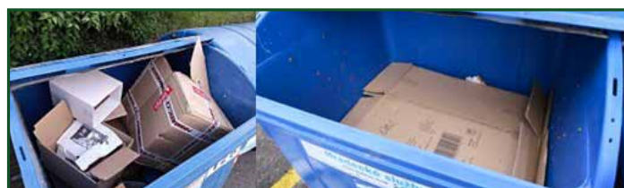
▲ Tabulka 1: Názorný příklad z Hradce Králové. Stejný kontejner o stejném množství kartonu.

Na přelomu roku jsme hodnotili dotazník odpadového hospodářství. Velice často se objevovaly připomínky plných, doslova „narvaných kontejnerů“ a tudíž nemožnost odpad do nádob vhodit. Tento problém je oboustranně řešitelný. Město při pořízení nových nádob na plast bude klást důraz, aby byly větší vyhazovací otvory. Přeplněné kontejnery papíru jsou však často výsledkem neohleduplnosti některých z nás. Pokud se v kontejneru nacházejí nerozložené krabice, je pochopitelné, že místa je málo a platí se spíše za odvoz vzduchu než papíru a kartonu. Plný kontejner nedbale vhozených krabic může být po jejich rozložení plný pouze z 1/3. I takový detail může zvýšit dostupnost třídění v našem městě.