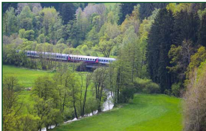
▲ V úseku Příbyslav - Pohled budou vyměněny všechny železniční mosty