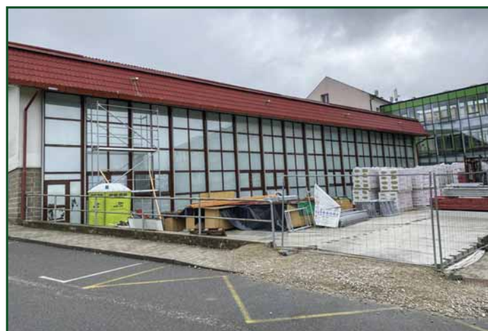
▲ Oprava sportovní haly - duben 2024.