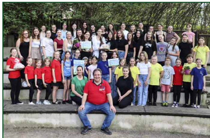
▲ Na fotografii: sbory DĚS naší ZUŠ a Prímadonky v Praze